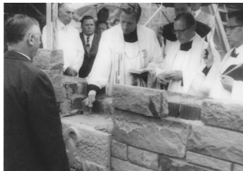
Grundsteinlegung am 30. Juli 1972